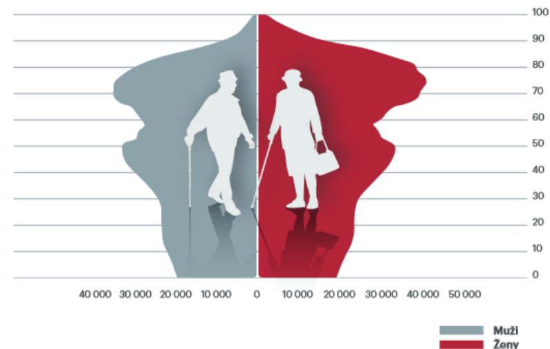
VEKOVÉ ZLOŽENIE OBYVATEĽSTVA 2060 V SR

NA JEDNÉHO DÔCHODCU BUDE PRIPADAŤ 1,31 ČLOVEKA V PRODUKTÍVNO M VEKU (OD 20 DO 62 ROKOV).